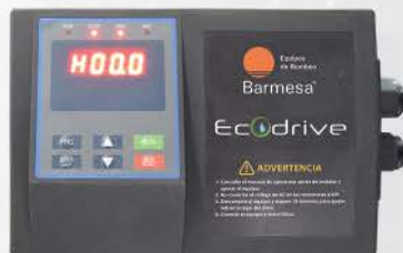
Variador de velocidad