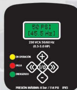
Display del variador